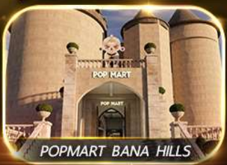
POPMART BANA HILLS

สัมพัศความงามหมู่บ้านฝรั่งเศสที่บานาฮิลล์ ซุปบิง POPMART